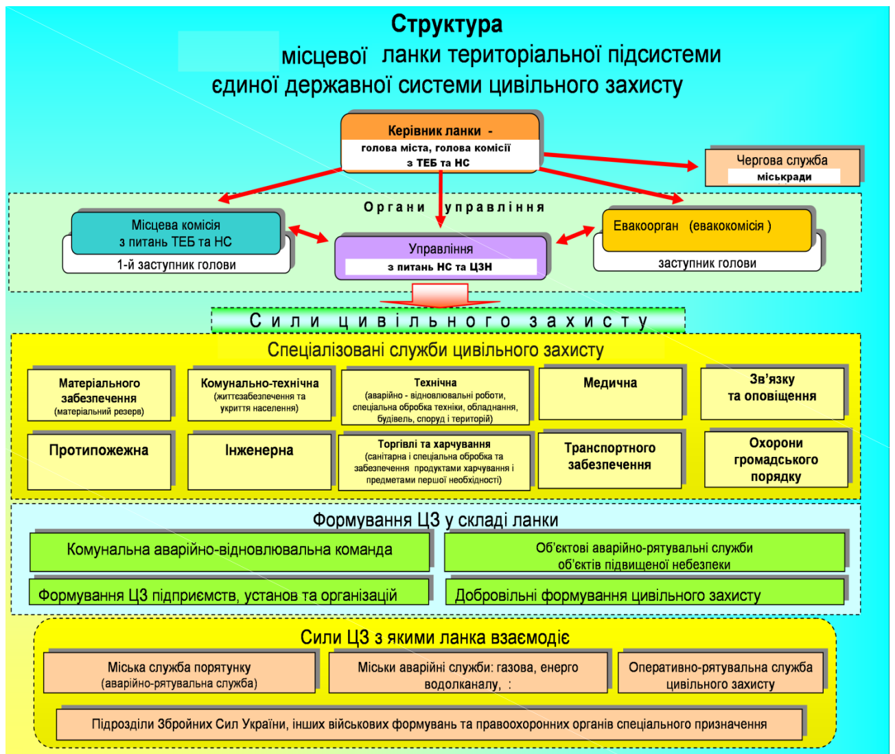
Рис.4. Організаційно–структурна побудова територіальної ланки в обласних та районних центрах, містах обласного підпорядкування

Відповідно до закону України «Про місцеве самоврядування в Україні» представницькі органи (ради) делегують свої повноваження і функції місцевим органам виконавчої влади та виконавчим органам місцевого самоврядування щодо вжиття необхідних заходів з ліквідації наслідків НС, інформування про них населення, залучення до цих робіт підприємства, установи та організації, а також населення.