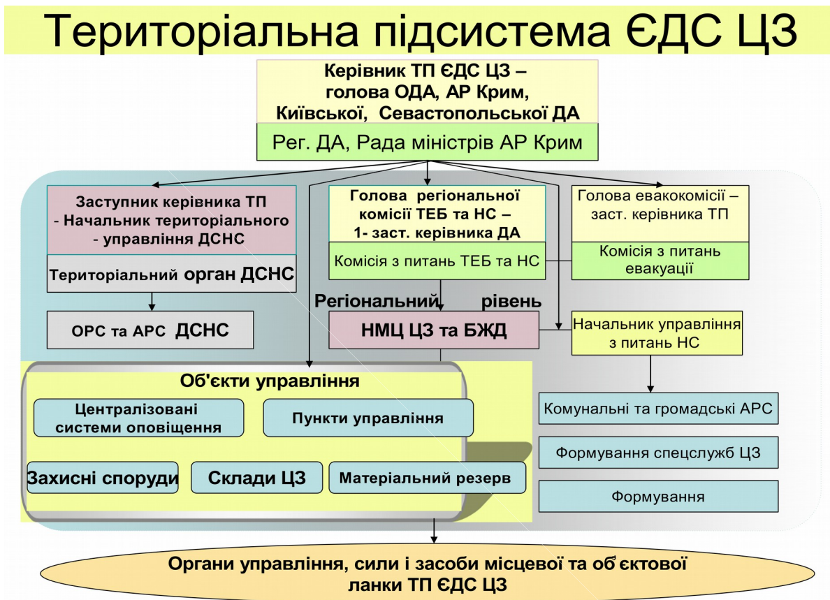
Рис. 3. Організаційна побудова територіальної підсистеми ЄДС ЦЗ

Безпосереднє керівництво діяльністю територіальної підсистеми, її ланок здійснюється посадовою особою, яка очолює орган, що створив таку підсистему, ланку.