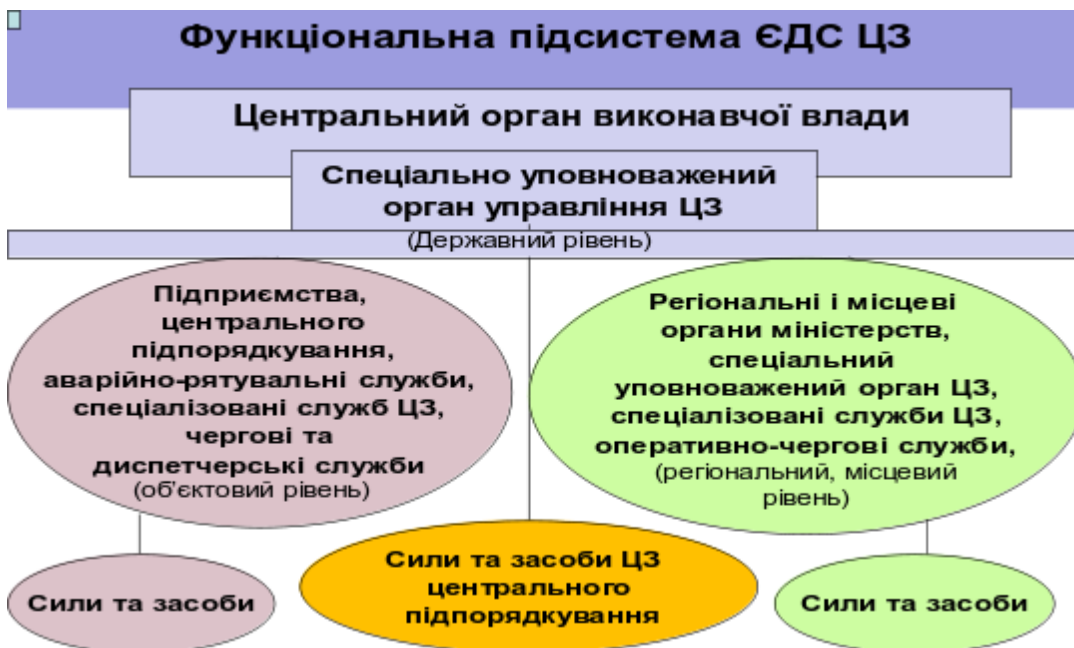
Рис.2. Організаційна побудова функціональної підсистеми ЄДС ЦЗ

Безпосереднє керівництво діяльністю функціональної підсистеми здійснюється керівником органу чи суб'єкта господарювання, що створив таку підсистему.